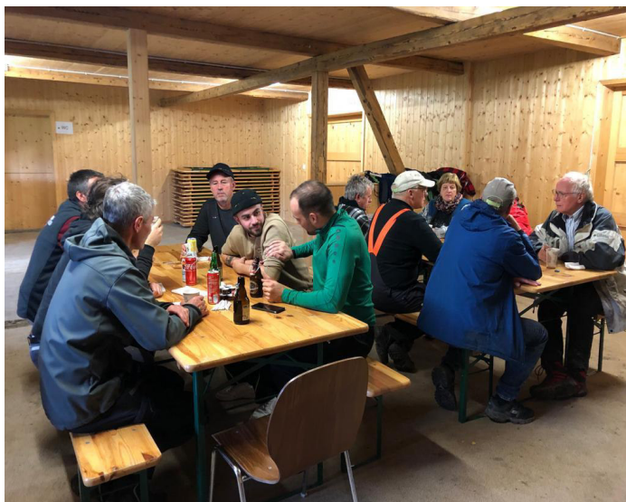
Als Dank offerierte der Verwaltungsrat den Helfer/innen eine feine Pizza von der Pizzeria Haag und ein kühles Getränk.