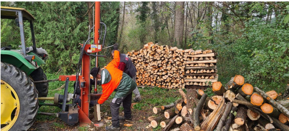
Holzarbeiten im Warowäldli direkt neben der Autobahn