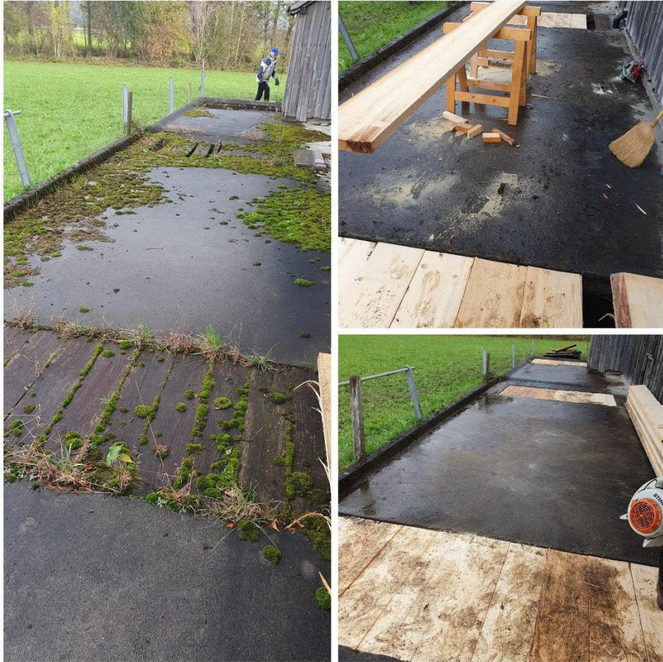
Abdeckung Güllengrube hinter dem Rossmad