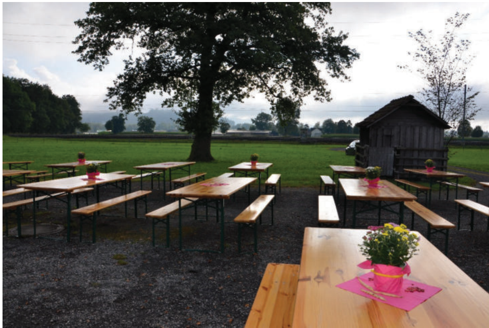
Alles bereit für die Gäste

Dank Einhaltung, der zu dem gegebenen Zeitpunkt geltenden Corona Schutzmassnahmen, konnte das traditionelle Bürgerfest im Rossmad durchgeführt werden. Dies freute nicht nur den Verwaltungsrat, positive und dankende Worte gab es auch von den teilnehmenden Ortsbürger/innen.