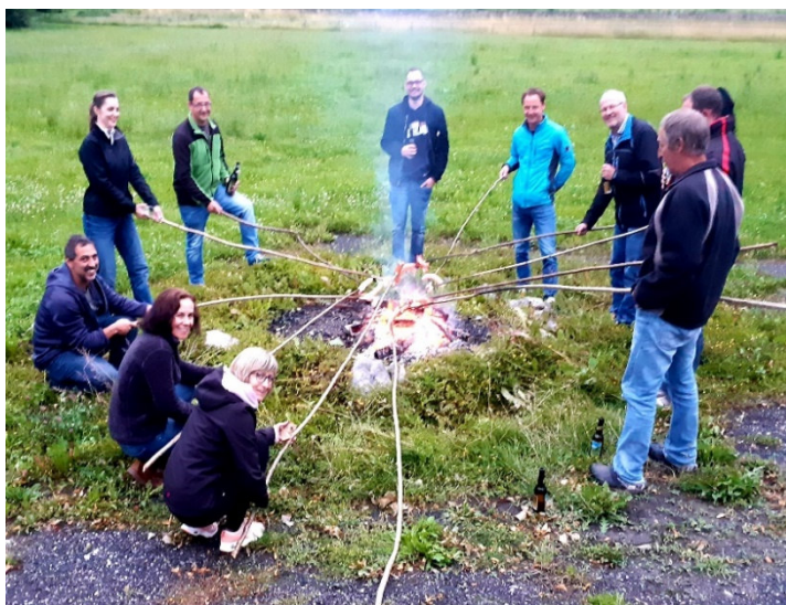
VR und GPK im Juni