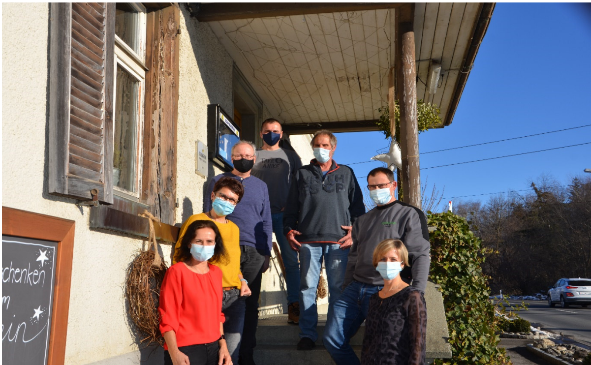
Verabschiedung im Dezember 2020

Anschliessend an die Sitzung und Verabschiedung, servierte uns das Bahnhöfli – Team, ein kulinarisch feines Mittagessen.