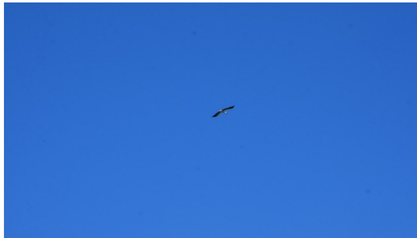
Still und einsam

Im Rossmad kehrte Stille ein. Einzig in den Monaten Juni – September fanden private Anlässe statt. Ansonsten wurden die Räumlichkeiten vor allem für die Verwaltungsratssitzungen genutzt.