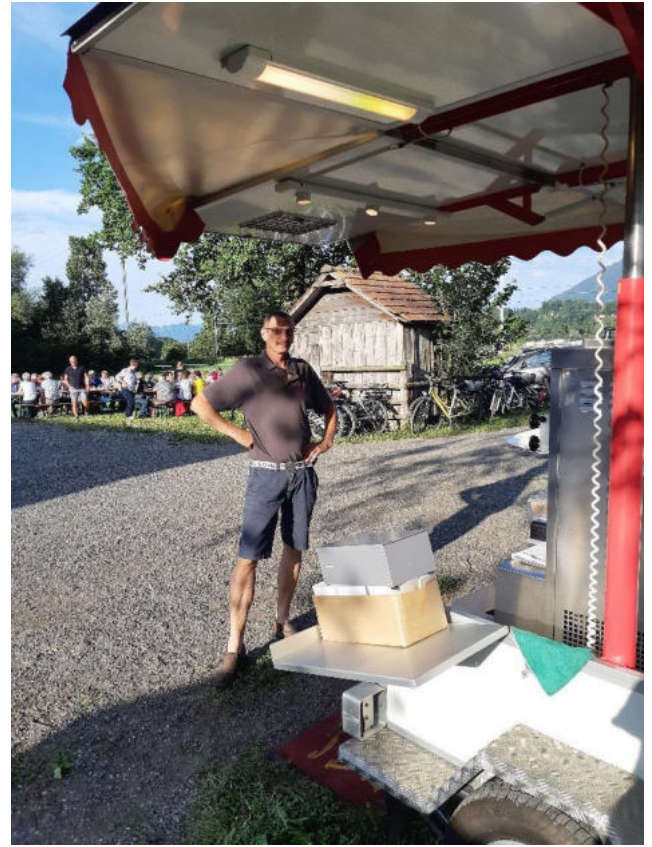
Der Güggeli- und Glacemann waren bereit für den Ansturm der Ortsbürger(innen).